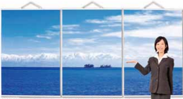
(W)841mm×(H)1189mm タペストリーを横に3枚重ねた例