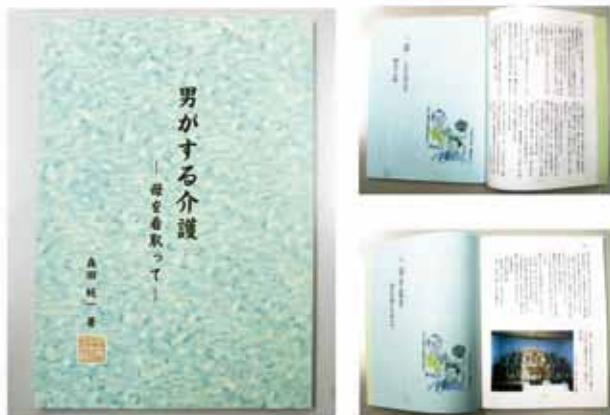
男がする介護 2012年/140頁/A4版

いまあるデータや写真をまとめて、身近な方々にお配りするだけでも、忘れられていく記憶が永遠の記録として残すことができます。弊社がこれまでお手伝いさせていただいた作品の一部を紹介させていただきます。