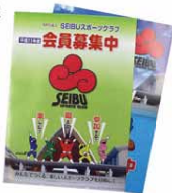
スポーツクラブ広報

富山市立神保小学校様が平成23年度富山県小中学校PTA広報紙コンクールにおいて「優秀賞」に選ばれました。当校は毎年コンクールで受賞されている常連校ですが、広報委員の皆さんの良いものを作りたいという思いが評価につながっているのだと思います。