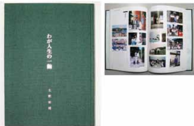
わが人生の一齣 2010年発行/170頁/B5版

この冊子は、著者がお母様の介護の様子をワープロで打ち替えていたものを弊社でコピーし、表紙を付け20冊だけおつくりしました。限られた予算の中でもお母様への愛が十分伝わってくる素敵な1冊です。