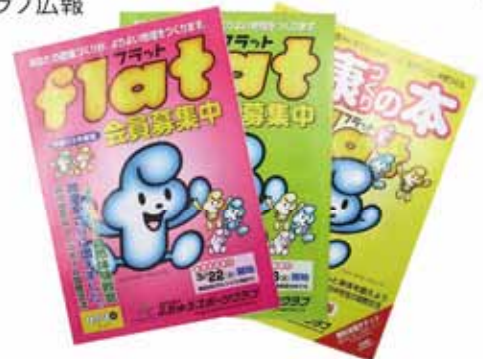
スポーツクラブ広報

目的や楽しさが的確に伝わる広報誌として日体協のホームページでも紹介されています。