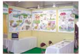
タペストリーを使用した展示風景

最近、展示会や学会等の発表でご好評をいただいております「タペストリー」です。富山県のトライアル商品にも認定いただきました。仕上がりきれいな上、破れないのが特徴です。しかし何と言っても持ち運びに便利なのが一番の特徴です。展示会や発表会には是非ご使用ください。